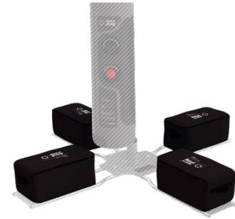
Sandsackset für Kreuzfuss (4 Stück ungefüllt geliefert) S 85.00 L 85.00