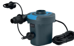
Elektrische Pumpe Standard 12 V + 230 V 105.00