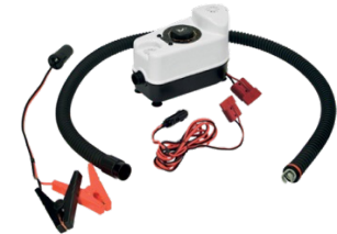
Elektrische Pumpe Premium 12 V 220.00 Optional mit Batterie 115.00