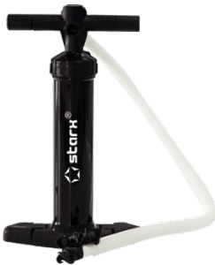
Handpumpe Premium OSS 16 45.00