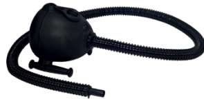
Elektrische Pumpe Premium 230 V 140.00