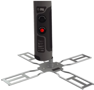
Kreuzfuss mit Rotator S (70.5 x 70.5 cm) 255.00 L (95 x 95 cm) 285.00