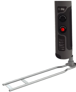
Autostellfuss mit Rotator 285.00